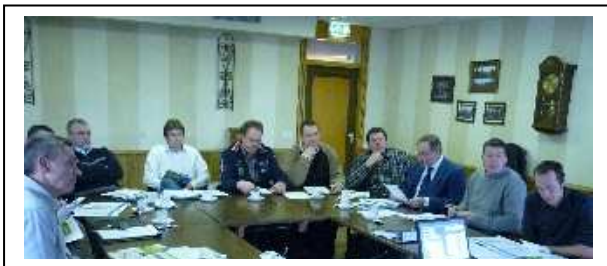
Kernbedrijven, Opdrachtgever ZLTO, en projectteam in overleg.

Een kerngroep van acht bedrijven werkt actief mee in het project en testen de bovenstaande toepassingen uit. Zij hebben ook een belangrijke rol om de ervaringen uit te dragen naar hun collega's.