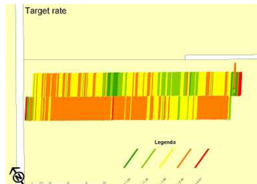
Voorbeeld van variabele doseringen bij loofdoding in consumptie aardappel op twee spuitbanen

Dit systeem is meerdere jaren op praktijkbedrijven toegepast jaren ervaring opgedaan met dit systeem door akkerbouwers en de resultaten zijn ronduit positief. Het systeem draagt ook in de praktijk bij aan een middelbesparing en daar heeft het eindresultaat niet onder te lijden.